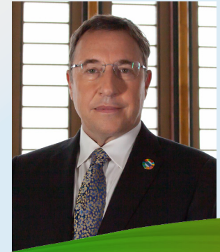
أخيم شتاينر مدير برنامج الأمم المتحدة الإنمائي

عندما شرعنا في صياغة خطتنا الاستراتيجية الطموحة منذ عامين، لم يكن بإمكاننا أن نتوقع التحديات الاستثنائية التي قد تطرحها جائحة كوفيد-١٩. وأعتقد أنّ الإجراءات السريعة التي اتخذناها لمساعدة الدول على الاستعداد والاستجابة والتعافي – والتي تدرج ضمن الاستجابة الموسّعة لمنظومة الأمم المتحدة – تثبت قيمة التحول الذي وضعته الخطة الاستراتيجية قيد التنفيذ. يُبد أنّ هذا التحول لم يكتمل بأي حال من الأحوال، ويُقرّ هذا الاستعراض بأنه ما زال يتعين علينا القيام بكثير من العمل في هذا الشأن. لكن نظرة سريعة على البرنامج الإنمائي الذي أمامنا اليوم – والذي يُقدم خدماته في الأزمات والأوضاع الهشة ويصل إلى أكثر الفئات تحلّفاً عن الركب مفكراً بعقلية جديدة في أوجه عدم المساواة من خلال تقرير التنمية البشرية لعام ٢٠١٩ – تكفي لإبراز التغيير الذي أدخلناه على طرق عملنا لتلبية الاحتياجات الإنمائية في عالم اليوم، من خلال النهج الرقمية، ومختبراتنا الجديدة لتسريع الأثر الإنمائي، والمزيد من الجهود.