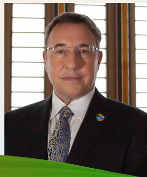
Achim Steiner Administrateur du PNUD

L orsque nous avons mis en place notre ambitieux Plan stratégique il y a deux ans, nous ne pouvions pas prévoir les défis majeurs que poserait la pandémie de COVID-19. Je suis convaincu que les mesures rapides que nous avons prises pour aider les pays à s’y préparer, à y répondre et à s’en relever (dans le cadre de la réponse plus large du système des Nations Unies) prouvent l’importance de la transformation mise en marche par le Plan stratégique. Cette transformation n’est en rien terminée et il ressort du présent examen qu’il reste encore beaucoup à faire. Mais si l’on considère le PNUD tel qu’il est aujourd’hui (une organisation qui intervient dans les situations de crise et de fragilité, qui atteint les populations laissées pour compte et repense les inégalités dans le cadre de son Rapport sur le développement humain 2019), il apparaît que nous travaillons différemment pour répondre aux besoins de développement actuels, au travers de l’adoption d’approches numériques et de nos nouveaux Accelerator Labs, entre autres. Je remercie tous nos partenaires pour leur soutien et leur coopération. Rejoignez le mouvement !