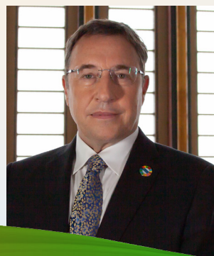
Achim Steiner Administrador del PNUD

“ C uando nos embarcamos en nuestro ambicioso Plan Estratégico hace dos años, no podíamos imaginar el desafío extraordinario que se presentaría con la pandemia de COVID-19. Creo que nuestra rapidez al prestar ayuda a los países para prepararse, responder y recuperarse —en el marco de la respuesta más amplia del sistema de las Naciones Unidas— está demostrando el valor de la transformación que el Plan puso en marcha. Esta transformación, sin duda, no ha concluido y este examen reconoce que aún nos queda mucho por hacer. Aunque al examinar el PNUD actual —que desarrolla su labor en contextos frágiles o afectados por crisis, llega hasta las personas que se han quedado más rezagadas, y plantea las desigualdades de manera novedosa en su Informe sobre desarrollo humano 2019— se vislumbra una forma de trabajar diferente con el fin de satisfacer las necesidades de desarrollo presentes, por ejemplo, los enfoques digitales o los nuevos laboratorios de aceleración, entre muchos otros. Agradezco a todos nuestros socios su apoyo y cooperación. Únanse al PNUD”.